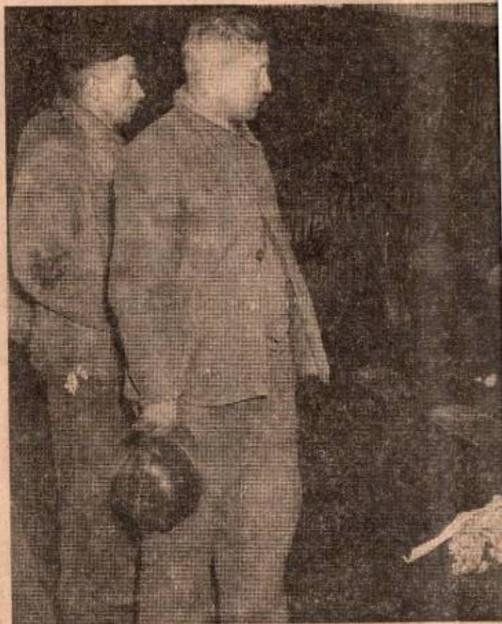
★ Het gevaar dreigde voortdurend en overal en al behoorden de mijnen geen rampen bespaard. In de loop der jaren verongelukten

De eerste alarmmeldingen worden vanaf 14.20 uur in de middag, — de schichten worden juist gewisseld —, naar boven getelefoneerd. Op de reddingsbrigades na, wordt de hele Hendrik ontruimd. In de buurt van de onheilsplek wordt nog menige mijnwerker